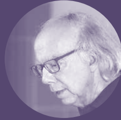
LIONEL ROGG ORGANIST

Zu Ihrem tollen Jahresplan gratuliere ich Ihnen von Herzen und wünsche allen Beteiligten gutes Gelingen und allzeit viel Publikum.